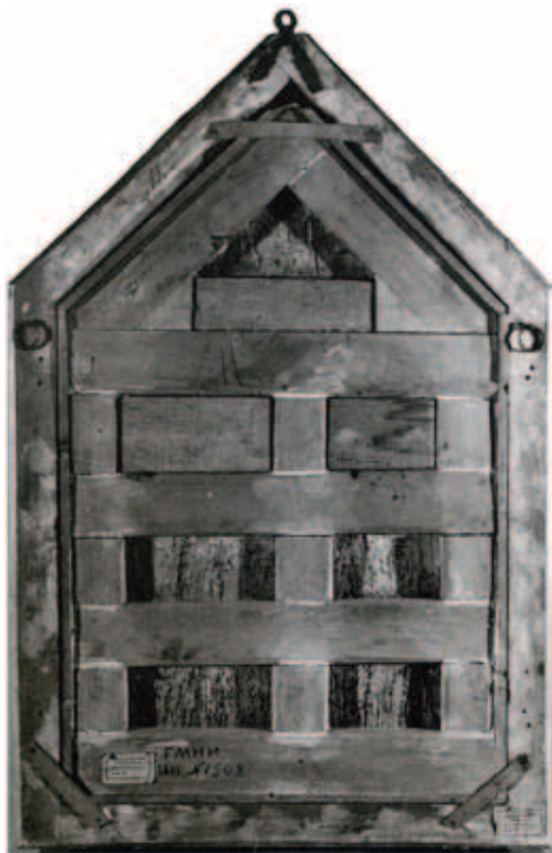
2. Обрат картины «Мадонна с донатором и ангелами». До реставрации

предшествующих реставраций. Очевидно, деревянная основа была опилена по нижнему торцу: изображения края мафория Мадонны и ее ступней отсутствуют, также усечено изображение птицы в правой нижней части. Доска имела многочисленные трещины, разрывы и деформации. Боковые стороны и торцы были закрыты деревянными обкладками, прибитыми к подрамнику. Несколько небольших фрагментов авторской древесины оторвались от доски вследствие ее усушки и удерживались только на склейке с обкладками. Наиболее глубокие вогнутые части картины были заполнены