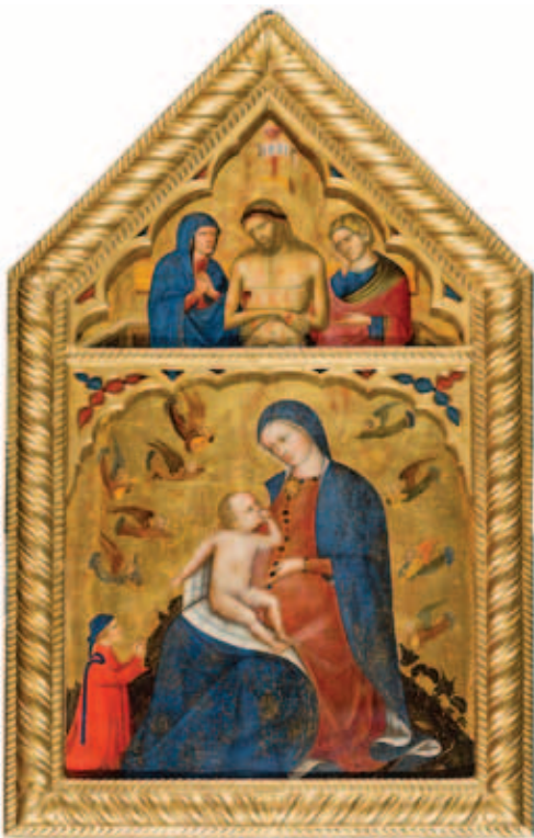
3. Николо ди Пьетро. Мадонна с донатором и ангелами. Оплакивание. После реставрации