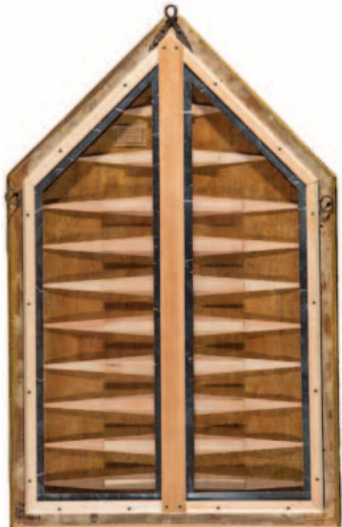
4. Обратная сторона картины «Мадонна с донатором и ангелами». После реставрации

укреплению аварийных участков, о чем свидетельствуют архивные записи.