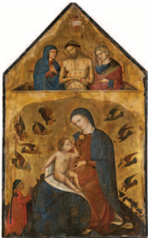
1. Николо ди Пьетро. Мадонна с донатором и ангелами. Оплакивание. Начало XV в. До реставрации

предшествующих реставраций. Очевидно, деревянная основа была опилена по нижнему торцу: изображения края мафория Мадонны и ее ступней отсутствуют, также усечено изображение птицы в правой нижней части. Доска имела многочисленные трещины, разрывы и деформации. Боковые стороны и торцы были закрыты деревянными обкладками, прибитыми к подрамнику. Несколько небольших фрагментов авторской древесины оторвались от доски вследствие ее усушки и удерживались только на склейке с обкладками. Наиболее глубокие вогнутые части картины были заполнены