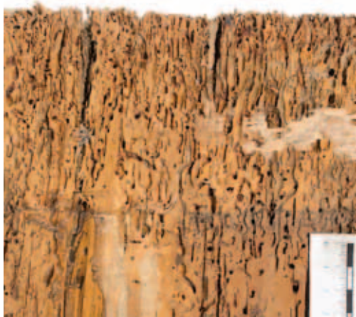
7. Фрагмент оборотной стороны картины «Мадонна с донатором и ангелами» после удаления прежнего подрамника

дискуссии, состояние экспоната представляло собой чрезвычайно сложный случай в музейной практике, требующий вдумчивого подхода. Вся полученная на семинаре информация была тщательно проанализирована, взвешены все риски, связанные с применением той или иной методики, только после этого был разработан и представлен для обсуждения реставрационному совету музея окончательный проект реставрации произведения.