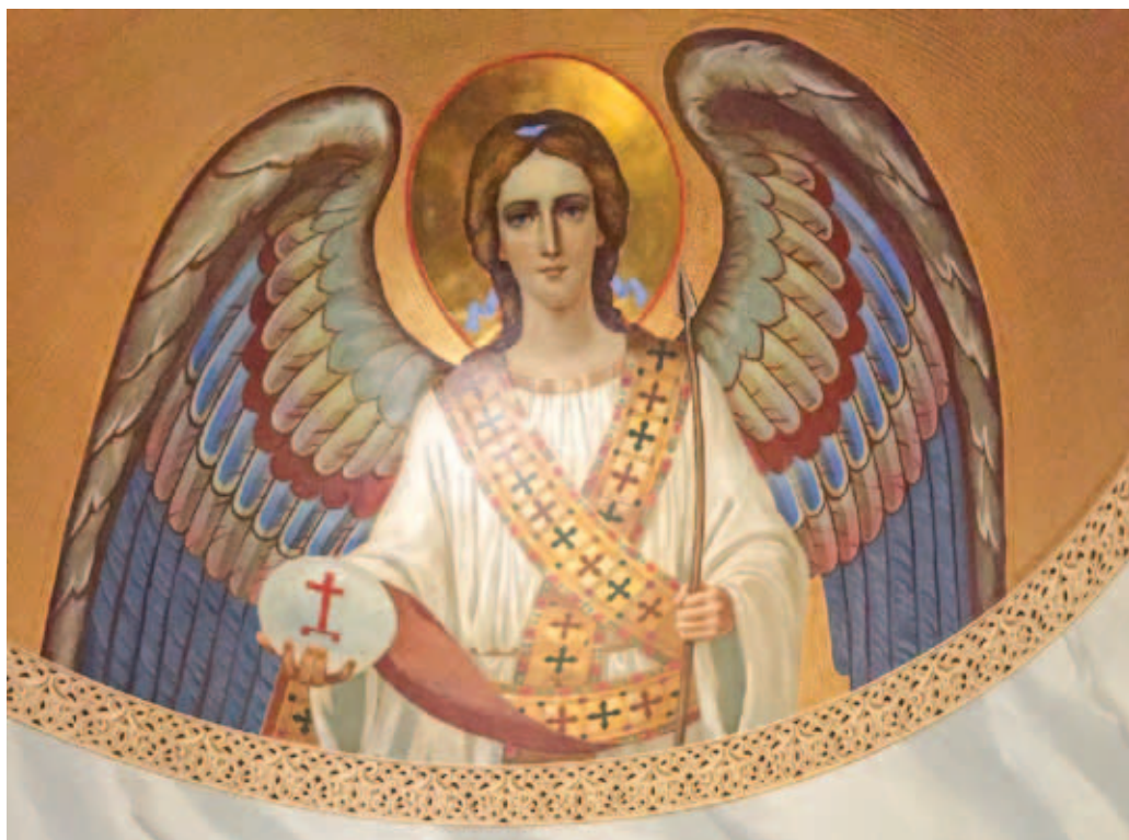
5. Архангел Михаил. Правая конха после воссоздания

первоначально предполагались две пары ангелов, однако когда эскиз уже был готов и утвержден, обнаружилась еще одна старая фотография, из которой становилось очевидно, что с каждой стороны от трона были изображены по три ангела. Это изменение обсудили на реставрационном совете и приняли решение делать именно так, как на исторической фотографии. Для боковых конх исполнены полуфигуры архангелов Михаила и Гавриила.