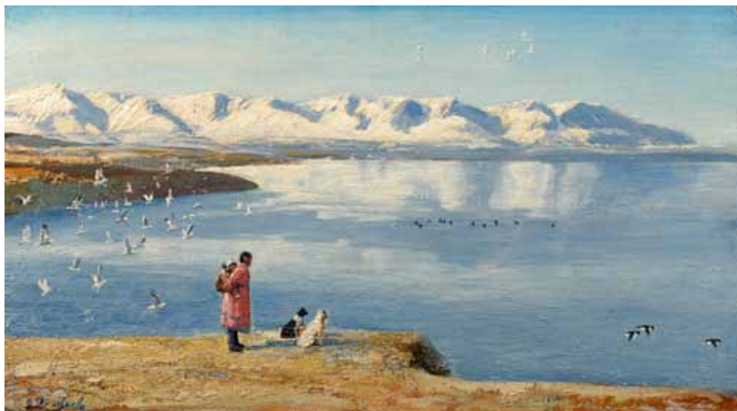
8. А. А. Яковлев. Голубой день. Ожидание. 1992. Холст, оргалит, масло. 49×88 см