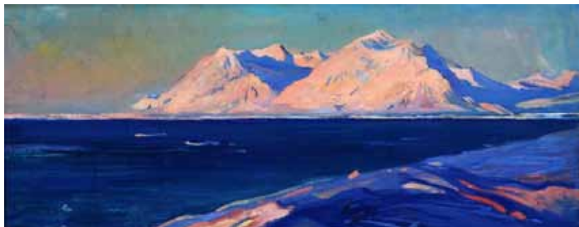
4. А. А. Яковлев. Гора Альхорн. 1961. Холст, масло. 38×90 см. Мурманский областной художественный музей