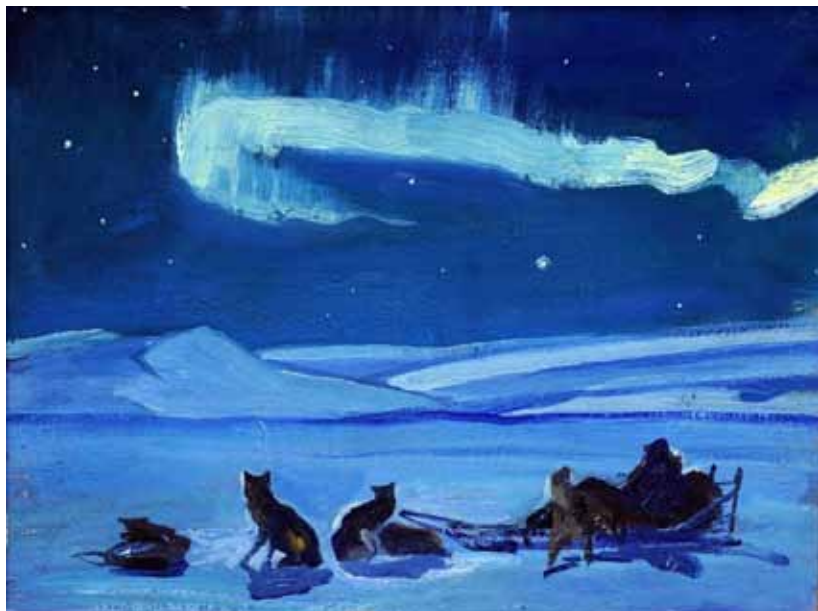
1. А. А. Яковлев. Северное сияние. 1960. Холст, масло. 30×40 см. Мурманский областной художественный музей