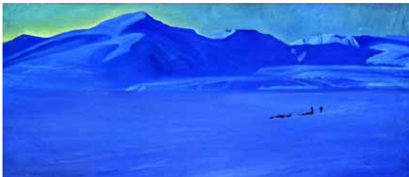
2. А. А. Яковлев. Через фьорд. 1961. Холст, масло. 55×120 см. Мурманский областной художественный музей