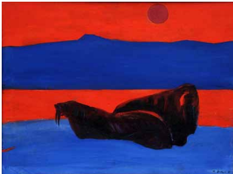
6. А. А. Яковлев. Хозяева Севера. Шпицберген. 1961. Холст, масло. 45×60 см. Мурманский областной художественный музей