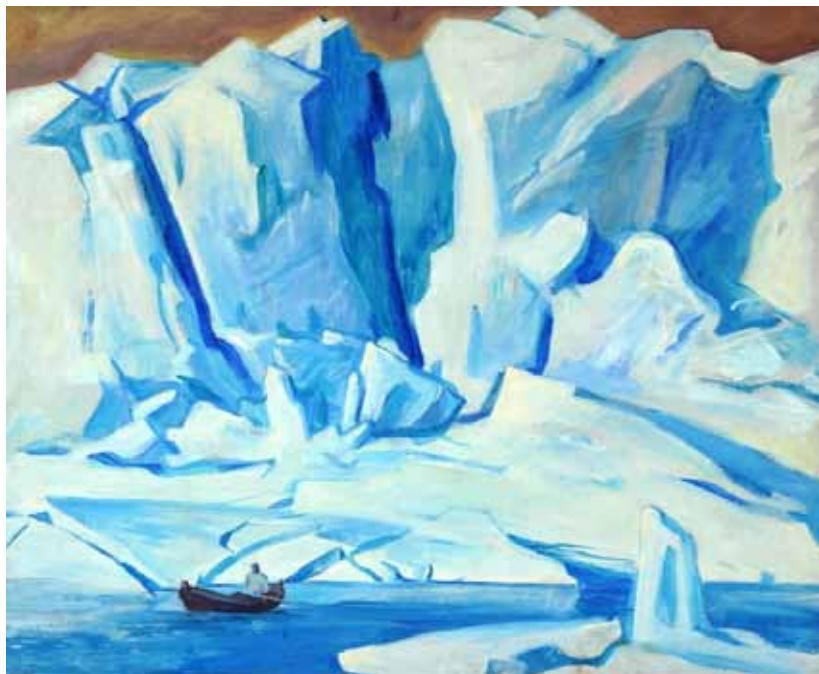
5. А. А. Яковлев. Ледник Норденшельда. 1961. Холст, масло. 65×78 см. Мурманский областной художественный музей