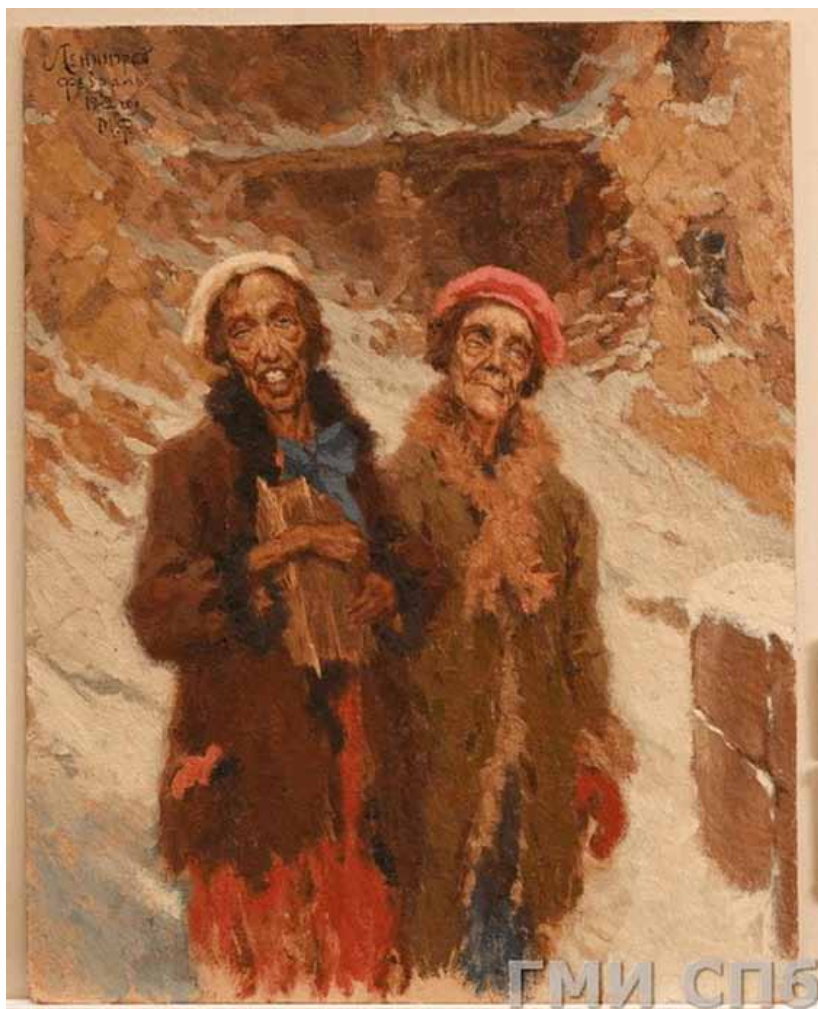
1. М. В. Фармаковский. Ленинград. Февраль 1942 г. Холст, масло. 63×49 см. Государственный музей истории Санкт-Петербурга. Инв.№-I-Б-475 ж ( https://goskatalog.ru/portal/#/collections?id=61749941 )