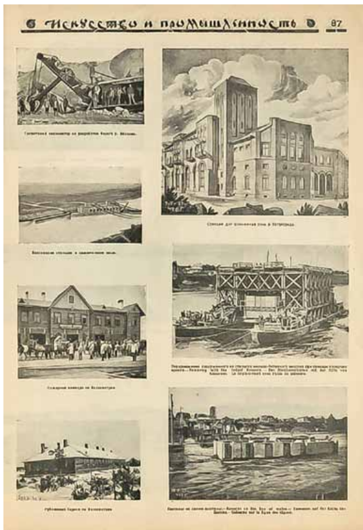
5. Фотоиллюстрации к статье П. И. Воеводина «Советское строительство. Волховстрой» в журнале «Искусство и промышленность». 1924. № 1. Январь