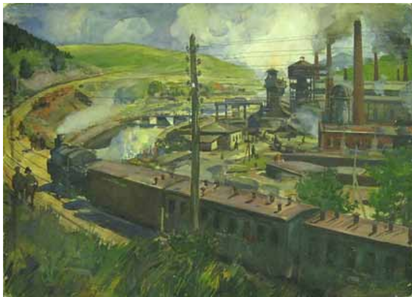
3. Н. И. Шестопалов. Вид Златоустовской домны. 1925. Бумага на картоне, акварель, гуашь. Екатеринбургский музей изобразительных искусств