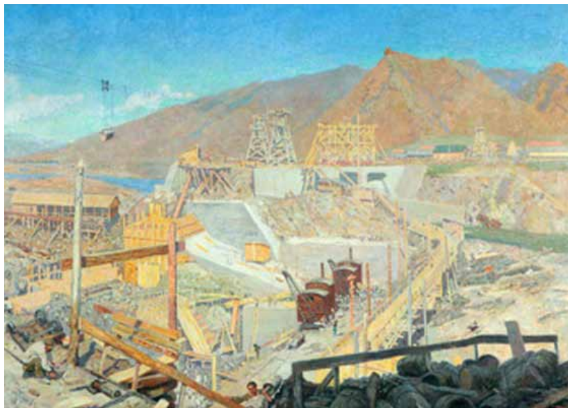
1. Б. В. Иогансон. Постройка Земо-Авчальской гидроэлектротехнической станции (ЗАГЭС) в 36 000 сил. Главная плотина. Октябрь 1925 г. 1925. Холст, масло. Государственный центральный музей современной истории России