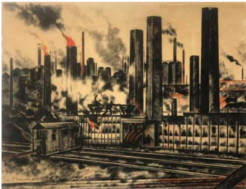
4. С. А. Павлов. Коксовые печи Донбасса. 1925. Бумага, тушь, акварель. Государственный центральный музей современной истории России