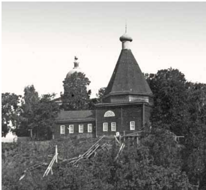
4. Никольская церковь в Варнавиной пустыни (1666). Фрагмент почтовой открытки начала XX в.