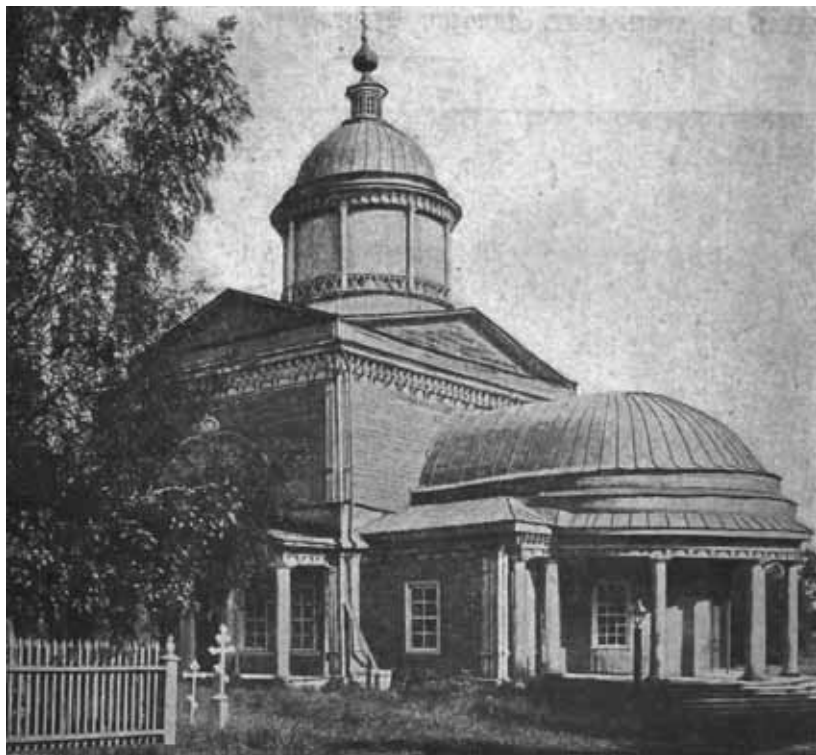
5. Троицкий собор в городе Варнавине [12]