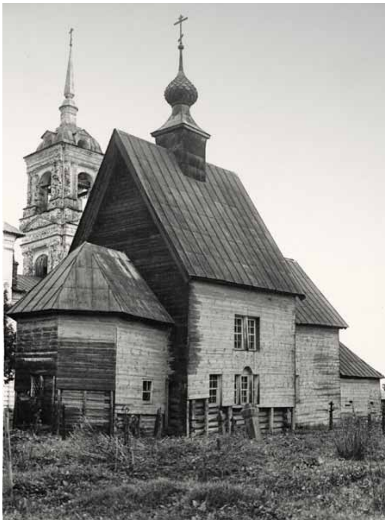
2. Преображенская церковь, в селе Верховье Галичского уезда. Фото конца 1950-х гг.