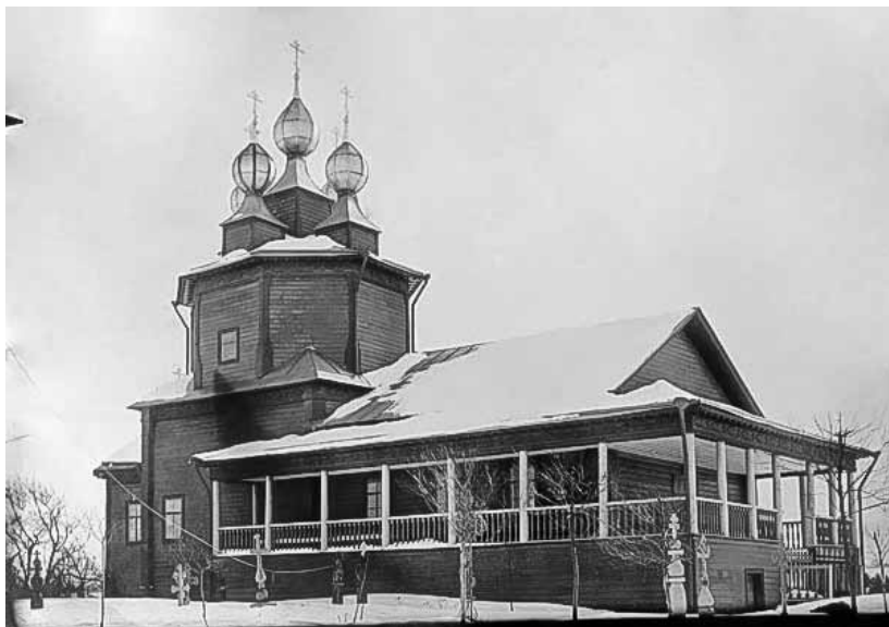
1. Воскресенская церковь в селе Георгиевское Солигаличского уезда. Фото С. А. Орлова, начало XX в.