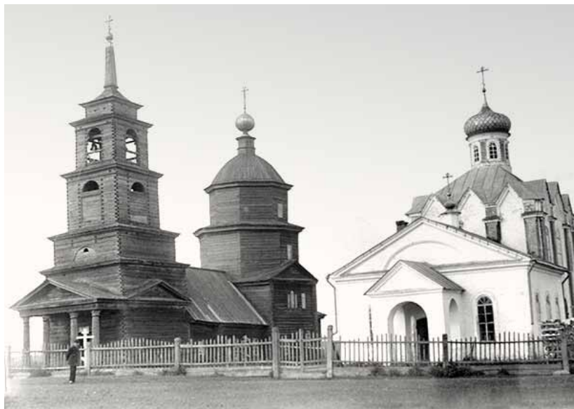
7. Храмовый комплекс в селе Ильинском на Чебоксарке Варнавинского уезда. Слева – Ильинская церковь, справа – церковь Рождества Богородицы. Фото В. А. Плотникова, 1909 г.