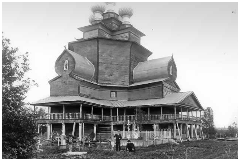
3. Николаевская церковь в селе Березовец на Поле Галичского уезда. Фото начала XX в.