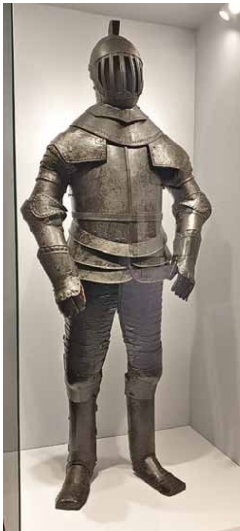
2. Неизвестный автор. Доспех Печального Рыцаря. После реставрации. Фото 2024 г. Архив Музеев Московского Кремля. Инв. № Ор-1563/1-9; Ор-1564/1-4