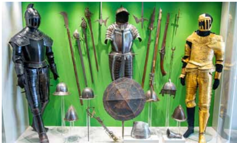
5. Неизвестный автор. Доспехи Печального и Радостного рыцарей в экспозиции ГМЗ «Царское Село», павильон Арсенал. Фото 2023 г. Архив ООО «РМ «Наследие»