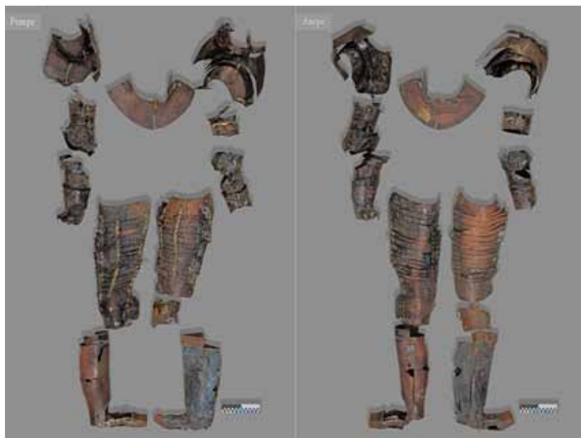
3. Неизвестный автор. Доспех Печального Рыцаря. Реверс, аверс. Общий вид до реставрации. ГМЗ «Царское Село», павильон Арсенал. Инв. № ЕД-1691-III, КП-37367. Фото 2023 г. Архив ООО «РМ «Наследие»