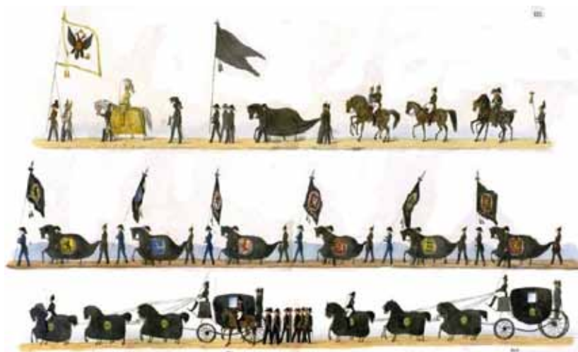
1. Литограф К. Гесс, печатник А. Патерсен. Описание погребения Николая I. Изображение Печального и Радостного рыцарей. Бумага, картон, дерматин; литография, акварель, белила, лак, печать, тиснение. 22,5×34,0 см. 1856. Архив библиотеки Оружейной палаты. ГИКМЗ «Московский Кремль»