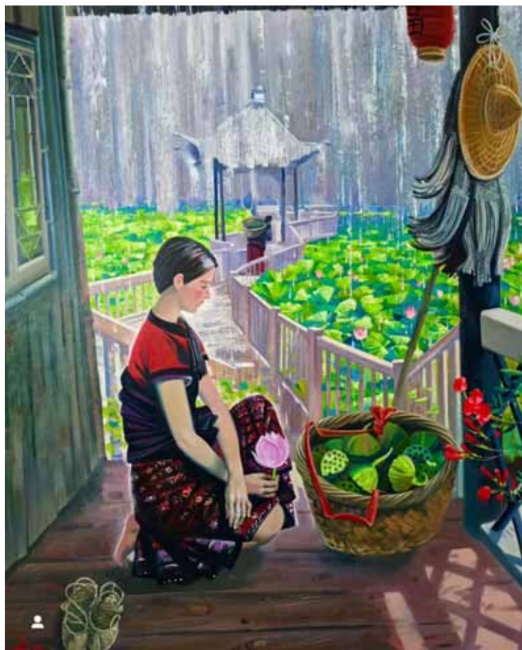
1. А. С. Кривонос. Дождь. Холст, масло. 2024