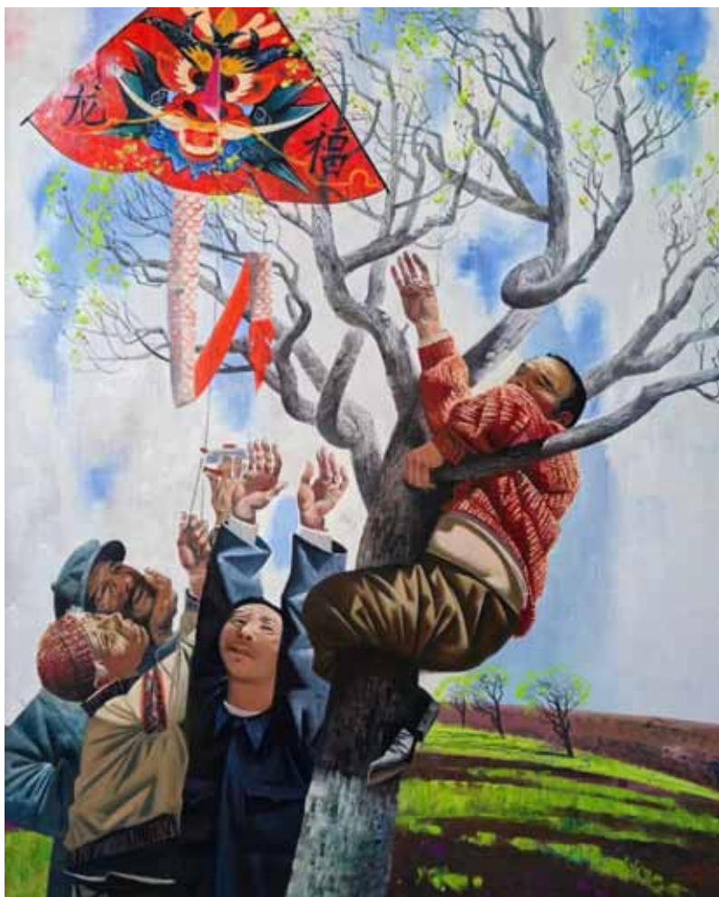
2. А. С. Кривонос. Ловцы счастья. Холст, масло. 2024