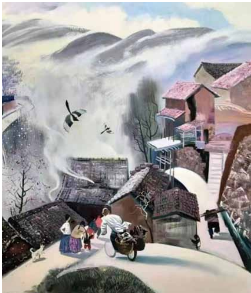
4. А. С. Кривонос. Непрерывность. Холст, масло. 2019