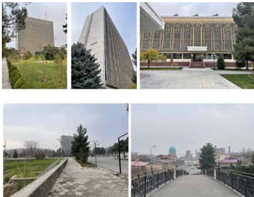
4. Комплекс Самаркандского областного Дома Советов. Арх. А. А. Балаев, Г. Е. Годлин, В. Махмудов, А. А. Коржев. 1970-е – 1980-е гг.