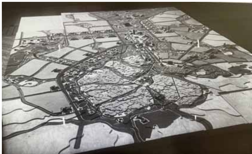
5. Проект генерального плана центра Самарканда. Начало 1970-х гг. [1]