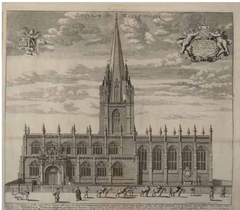
3. Дэвид Логган. Общий вид собора Девы Марии со стороны бокового фасада. 1675. Из комплекта: «Loggan David. Oxonia illustrata, sive Omnium celeberrimae istius universitatis collegiorum...». Бумага, гравюра резцом и офортом. 40,5×44,5 см. Государственный Эрмитаж. Инв. номер У-381/15