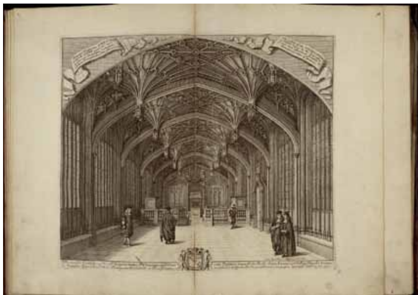
4. Дэвид Логган. Interior prospectus scholae theologicæ Oxoniæ... 1427. Из комплекта: «Loggan David. Oxonia illustrata, sive Omnium celeberrimæ istius universitatis collegiorum...». 1675. Бумага, офорт. 41,8×54 см. Государственный Эрмитаж. Инв. номер У-381/10