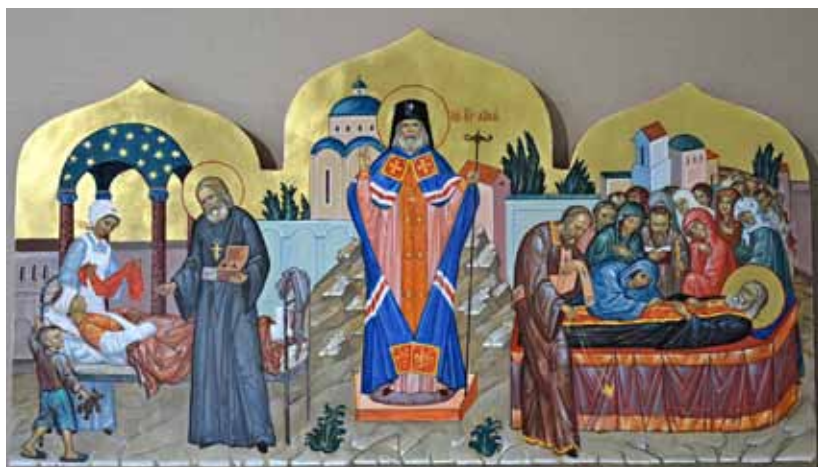
4. Житийная икона святителя Луки Крымского. Иконописец М. Селецкий. 2016