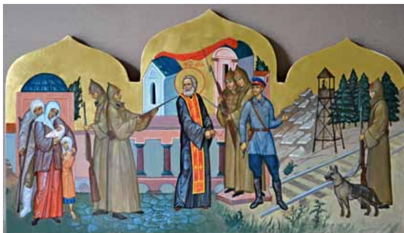
3. Житийная икона святителя Луки Крымского. Иконописец М. Селецкий. 2016.