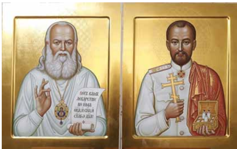
1. Священноисповедник Лука Крымский. Святой страстотерпец Евгений Боткин. Иконописец Ю. Филиппов. 2024