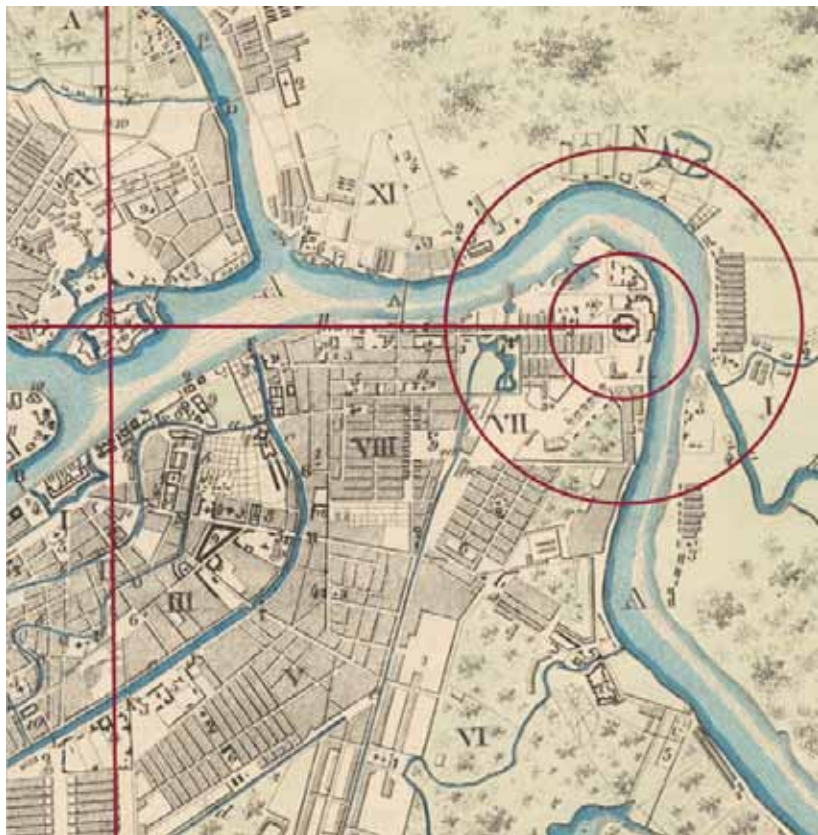
1. Широтная и меридианная оси Санкт-Петербурга, центрическая основа городского ландшафта вокруг монастыря