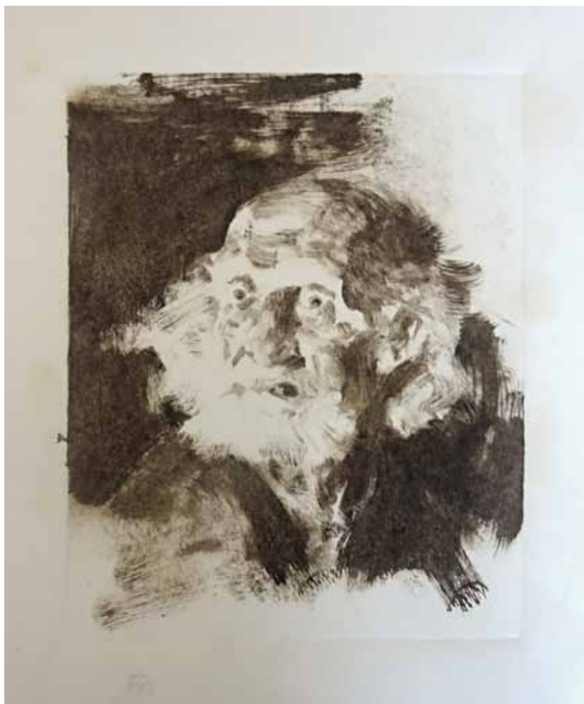
З. А. Тыщенко. Старик. Монотипия. 2023

Научные труды Санкт-Петербургской академии художеств. Вып. 66: Сохранение культурного наследия. СПб. : С.-Петербург. акад. художеств, 2023. При цитировании ссылка обязательна