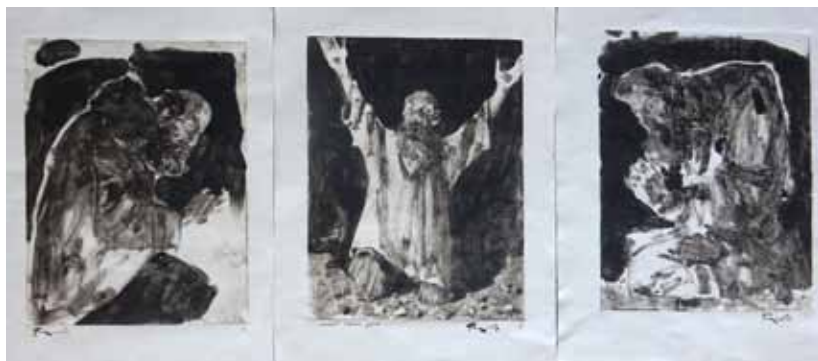
4. А. Тыщенко. Триптих «Спасите наши души!». Монотипии. 2023