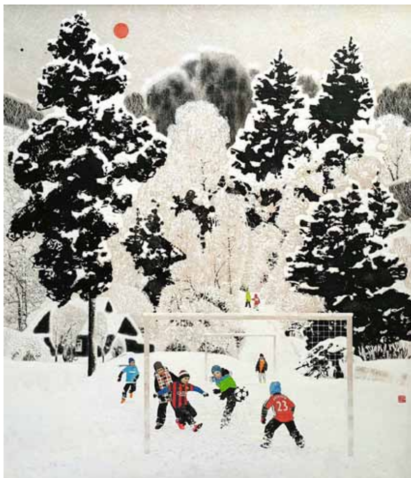
2. М. В. Моргунов. Хет-трик. 2016. Холст, масло. 170×150 см

Научные труды Санкт-Петербургской академии художеств. Вып. 66: Сохранение культурного наследия. СПб. : С.-Петербург. акад. художеств, 2023. При цитировании ссылка обязательна