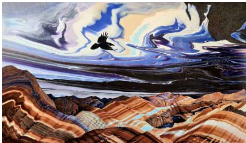
5. М. В. Моргунов. Ворон. 2021. Смешанная техника, акрил. 179×290 см