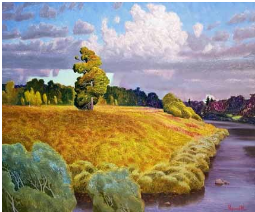
4. М. В. Моргунов. Липа на берегу реки. 2019. Холст, масло. 100×120 см