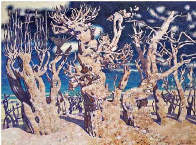
3. М. В. Моргунов. Сухие деревья. 2017. Холст, масло. 140×190 см