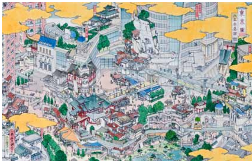
2. Акира Ямагути. Токио: холмы Роппонги. 2005. Бумага, шариковая ручка, акварель. 40×63 см

Научные труды Санкт-Петербургской академии художеств. Вып. 65: Проблемы развития зарубежного искусства. СПб. : С.-Петерб. акад. художеств, 2023. При цитировании ссылка обязательна