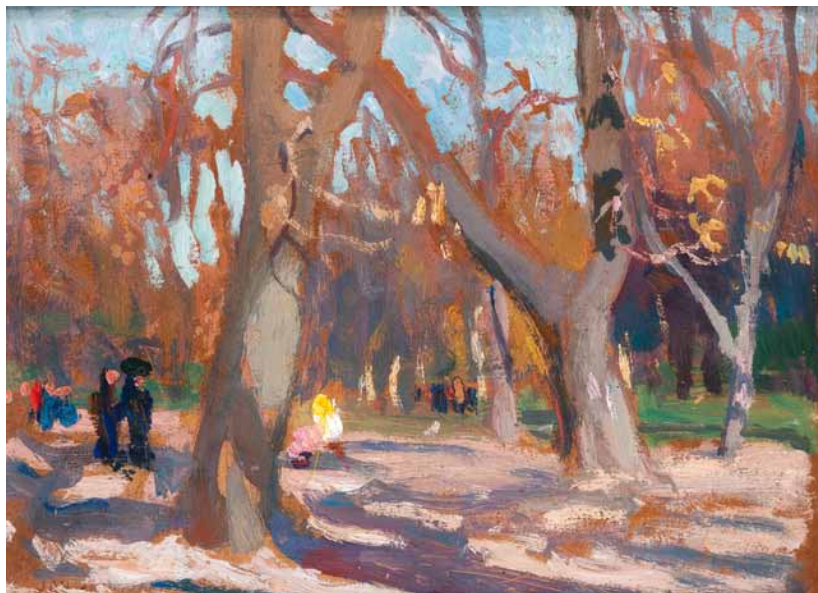
З. Я. Станиславский. Плянты. Парк в Кракове. 1903. Картон. Национальный музей, г. Вроцлав