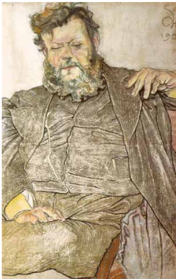
1. С. Выспяньский. Портрет Яна Станиславского. 1904. Пастель. Национальный музей в Варшаве