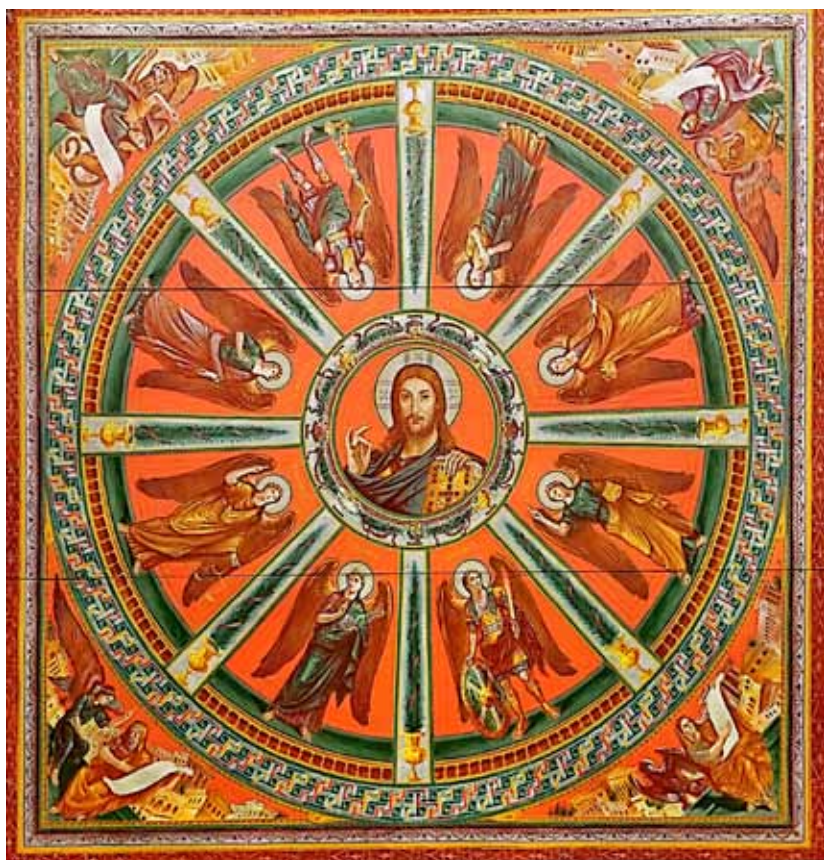
3. А. С. Гира. Эскиз росписи подкупольного пространства. 2022. Бумага, темпера. 350×350. Мастерская А. К. Крылова