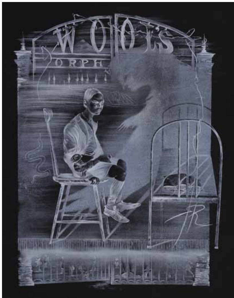
1. Е. Г. Самойлова. Thom Riddle Sr. Wool's Orphanage, negative. 2021. Бумага, литография. 50×66. Мастерская А. Н. Складенко